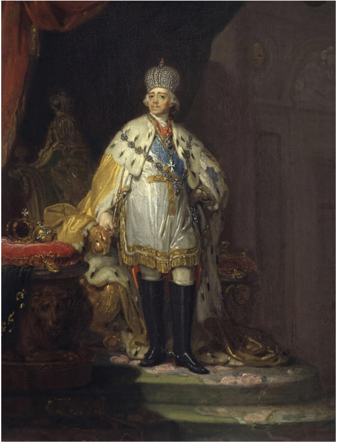
В. Боровиковский портрет императора Павла I