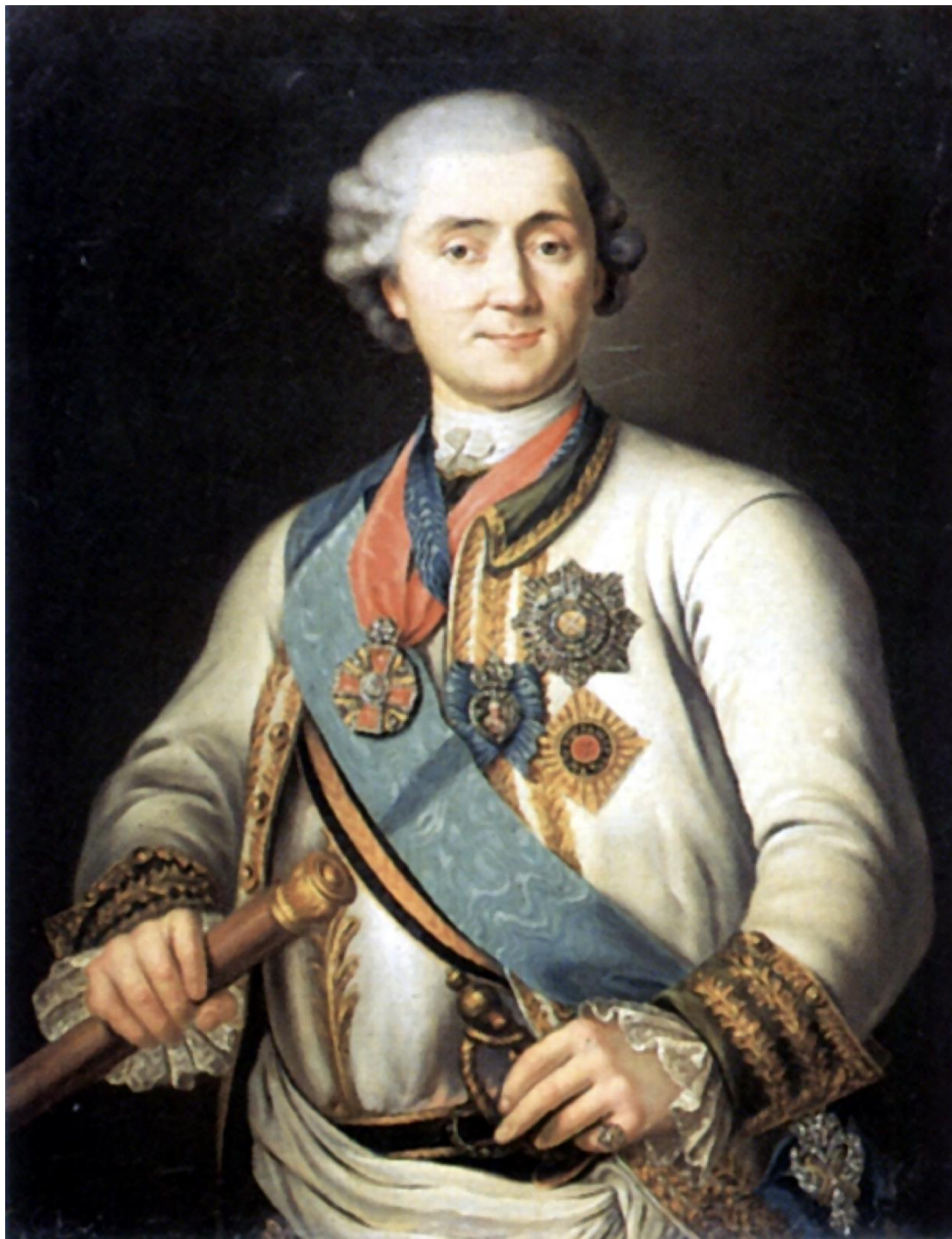
В. Эрикссон Портрет графа А.Г. Орлова