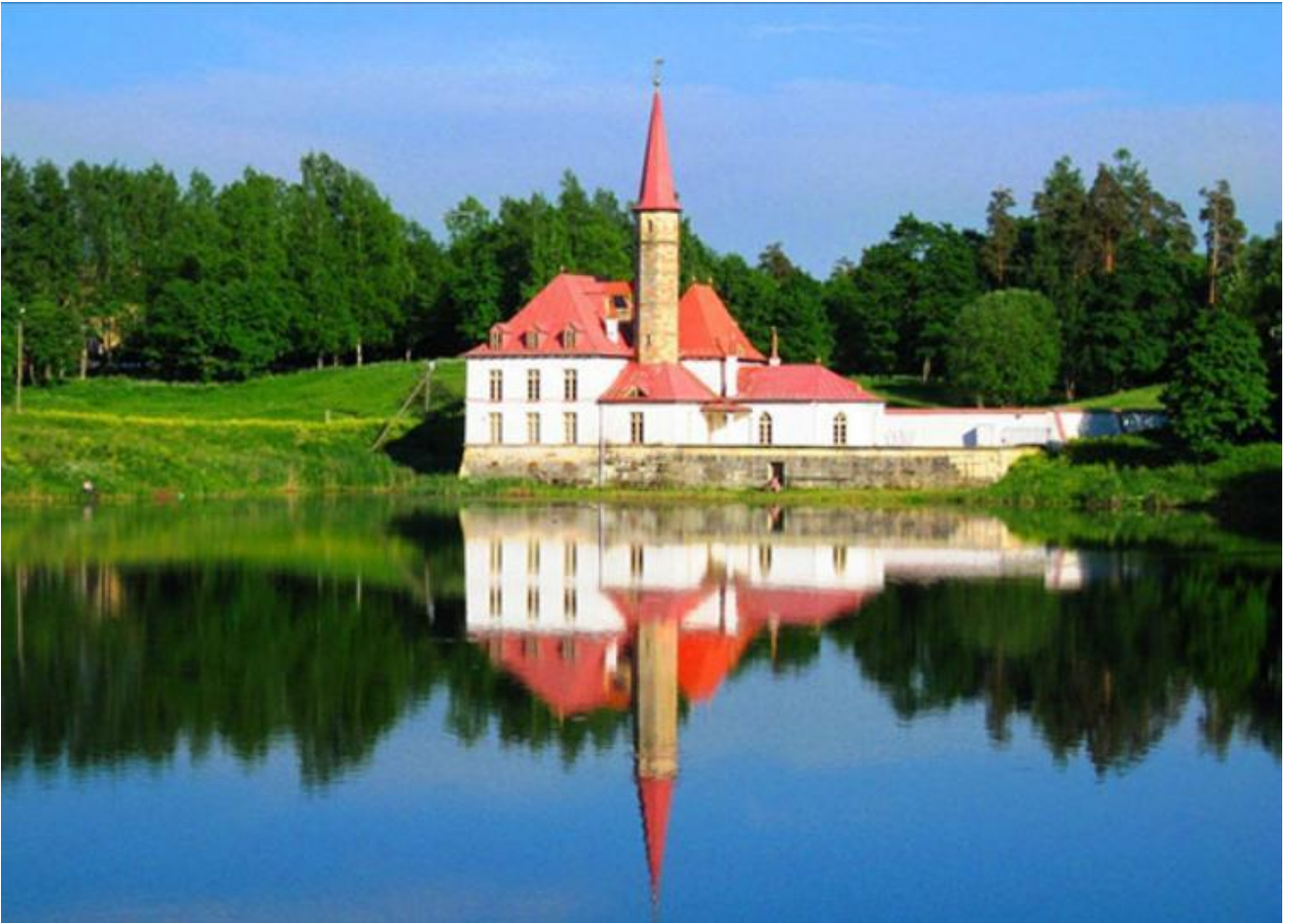
Н. Львов. Приоратский дворец