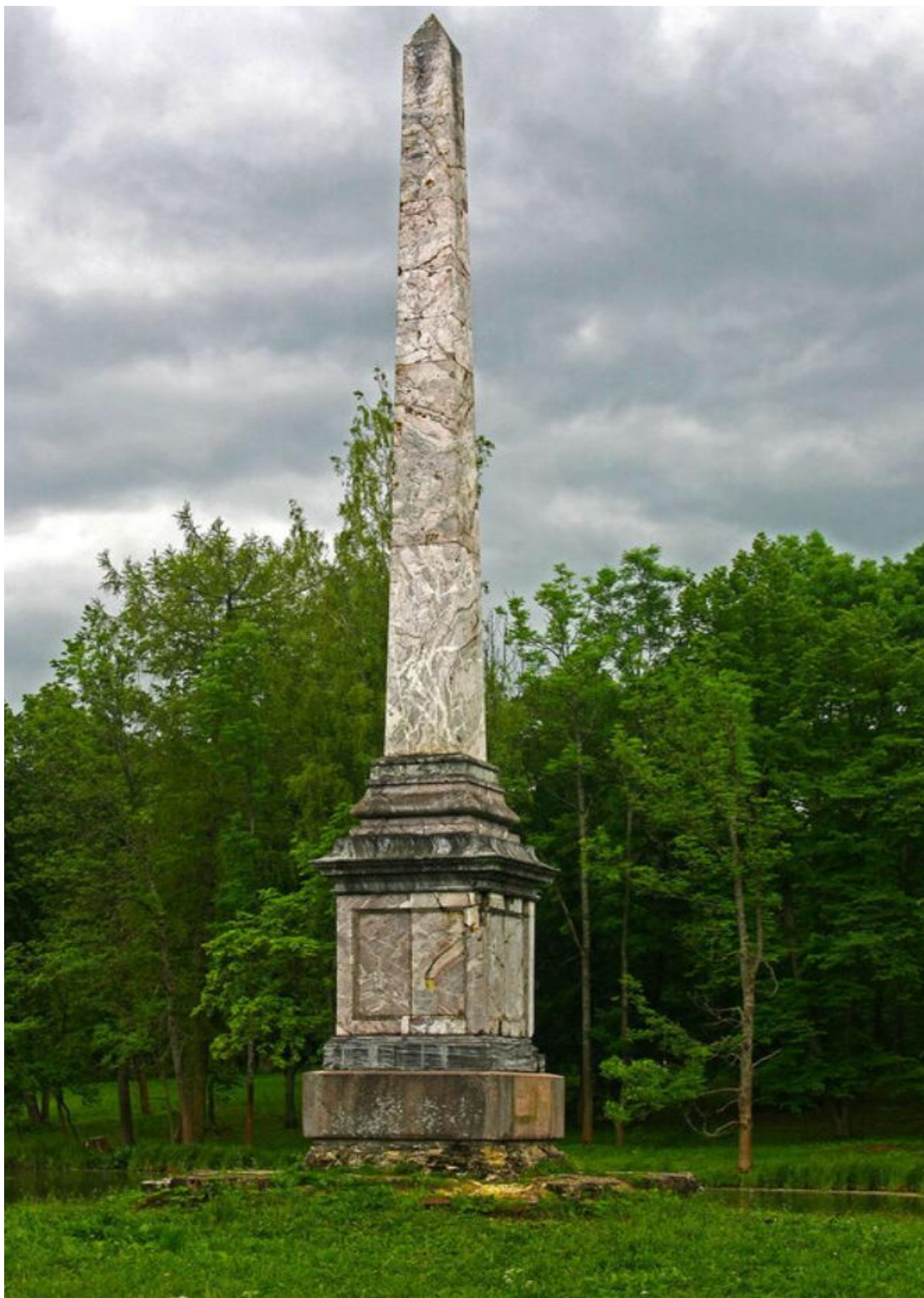
А.Ринальди. Чесменский обелиск