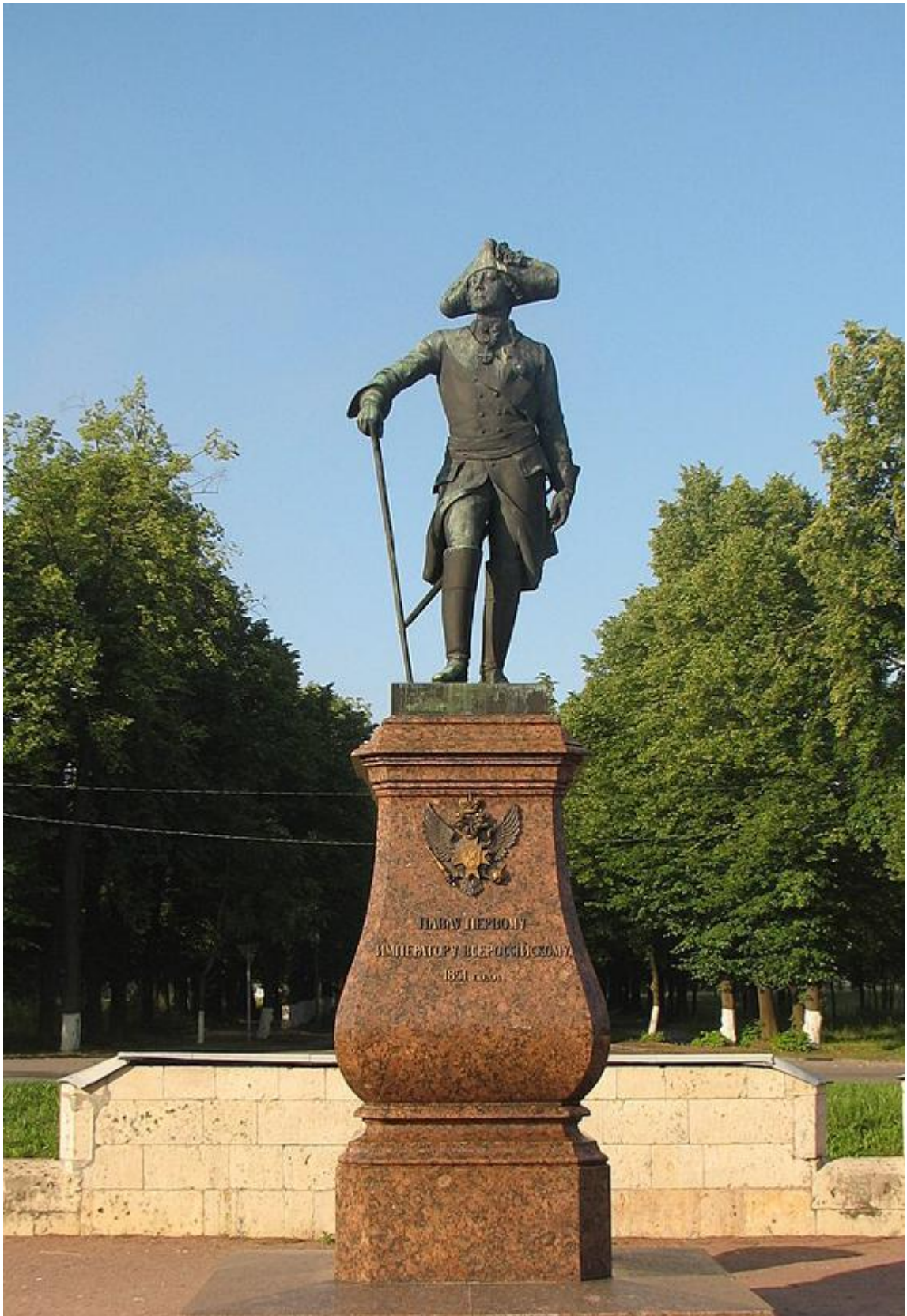
И. Витали. Памятник Павлу I