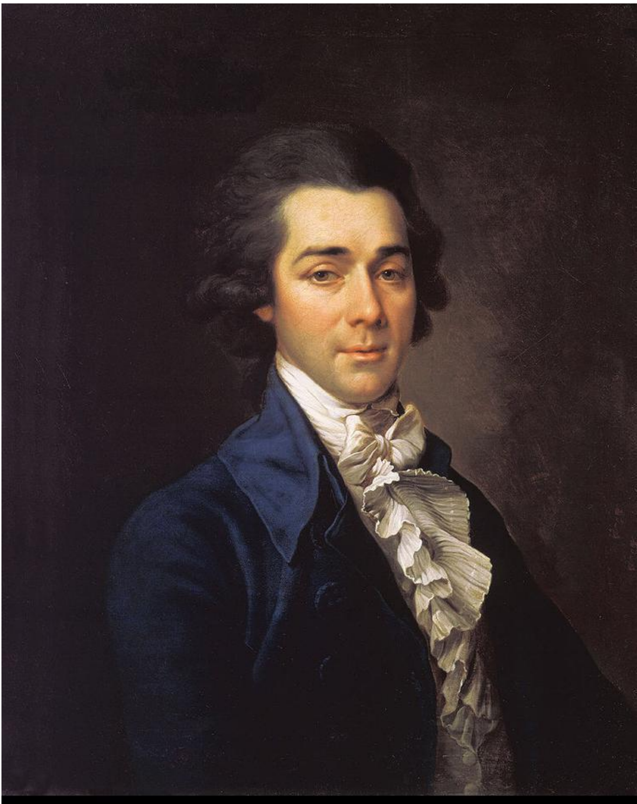
Д. Левицкий. Портрет Львова Н.А.