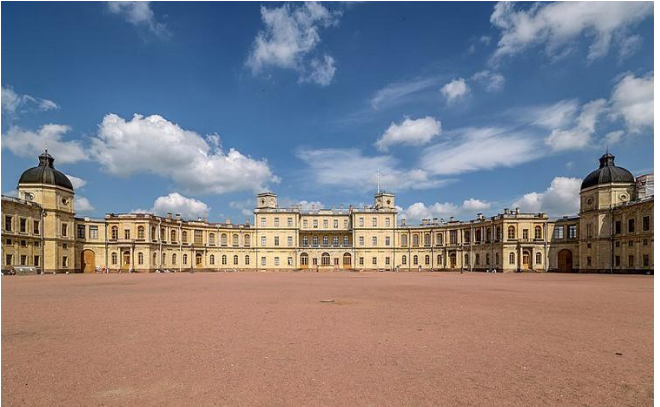
А. Ринальди. Большой Гатчинский дворец