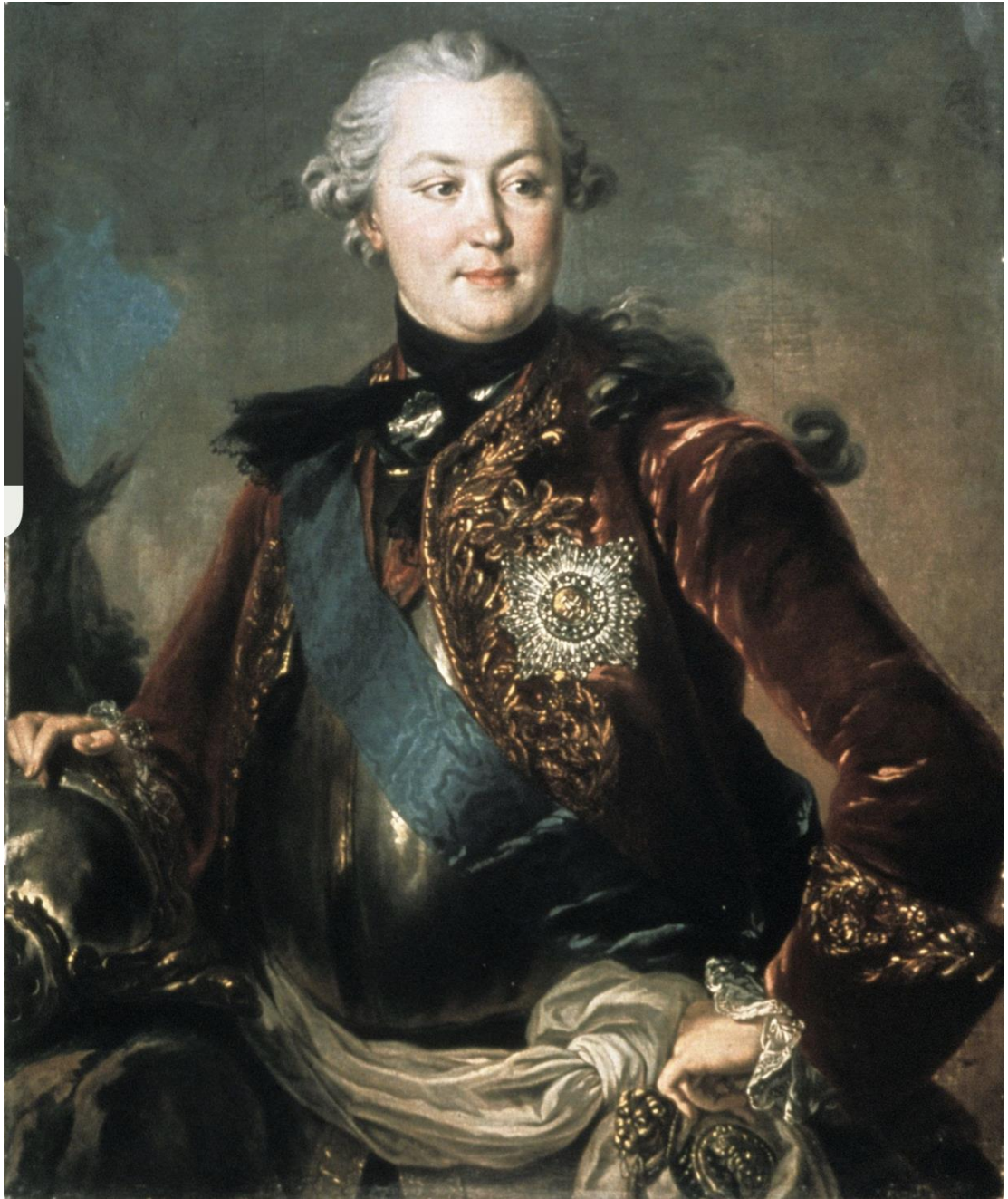
С.Торелли Портрет Григория Орлова